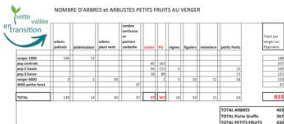
Tableau des arbres plantés :

Les pépinières (en rouge dans le tableau) : cela montre le potentiel de l'association à planter de nouveaux vergers : 97 arbres disponibles, et 367 porte greffes libres à greffer.